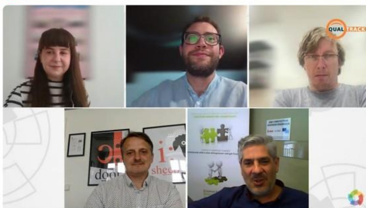
QualTrack Webinar - Quality assessment system for providers of adult education